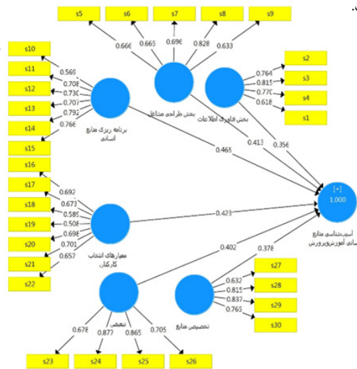
نمودار ۴-۱ تاثیر عوامل آسیب زا بر آسیب شناسی منابع انسانی

SRMR= 0/065 Chi-Square = 1245/187 NFI = 0/941 GOF = 0/297