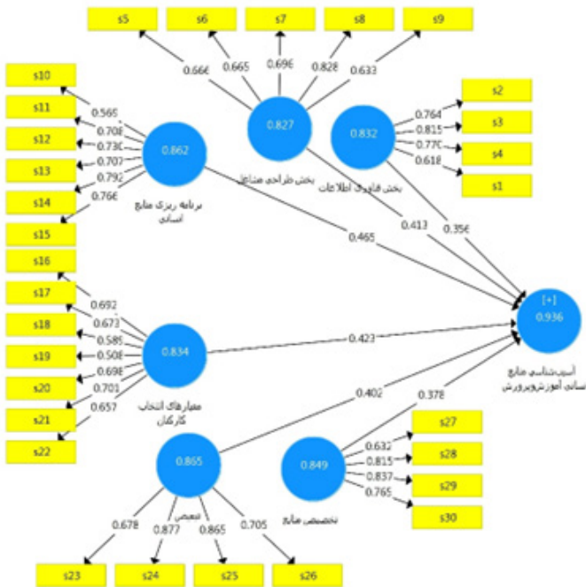
نمودار ۳-۴ ضریب پایایی ترکیبی