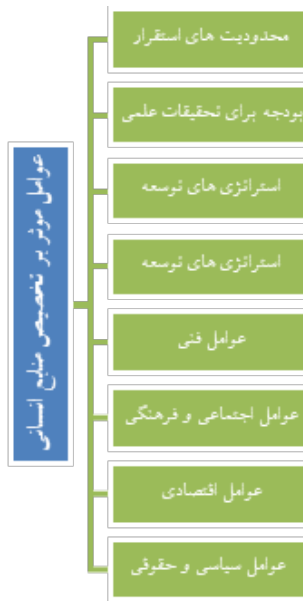
شکل ۱: عوامل مؤثر بر تخصیص منابع انسانی (یان و لو، ۲۰۲۰).